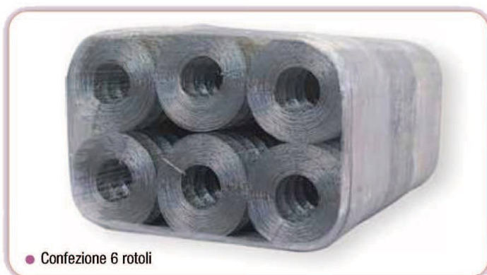
● Confezione 6 rotoli