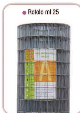
● Rotolo ml 25