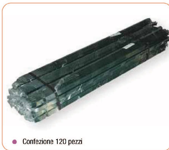
● Confezione 120 pezzi