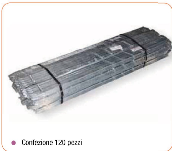
● Confezione 120 pezzi