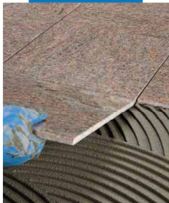
Posa di marmo prelevigato a pavimento