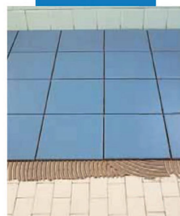
Sovrapposizione di ceramica su ceramica esistente con Keraflex grigio