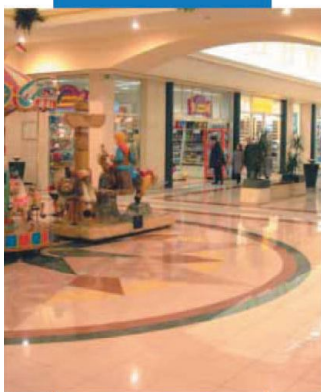
Esempio di posa di gres porcellanato - Centro Commerciale Zanchetta - Treviso