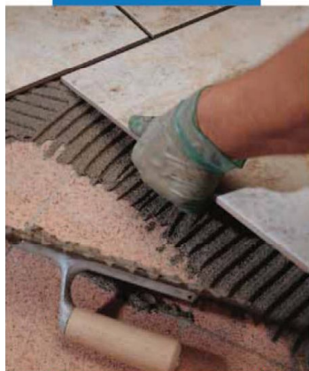
Sovrapposizione di un rivestimento in monocottura su marmette esistenti

– membrane impermeabilizzanti in Mapelastic o Mapegum WPS .