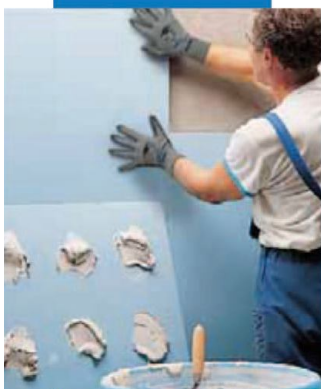
Posa di lastre di polistirolo con Keraflex bianco