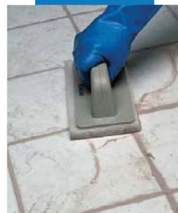
Finitura con Scotch-Brite®