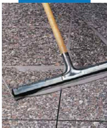
Stuccatura di pavimento in granito prelevigato con racla

idratati o in sottofondi non asciutti o non adeguatamente protetti dall'umidità di risalita.