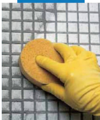
Finitura di rivestimento in mosaico vetroso con spugna