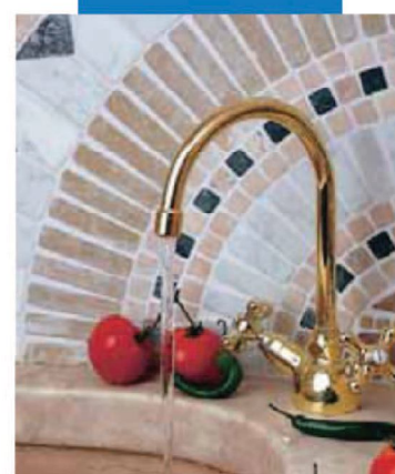
Esempio di stuccatura di mosaico in una cucina