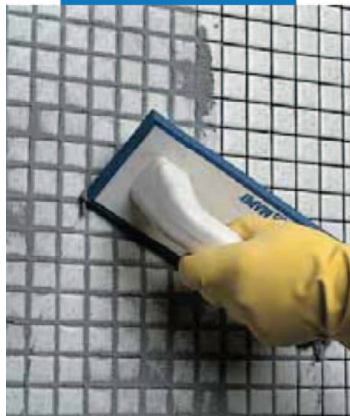
Stuccatura di rivestimento in mosaico vetroso (in bagno) con spatola