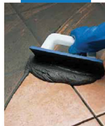
Stuccatura di monocottura con spatola